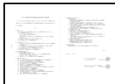
会社と交渉し約束した協定書