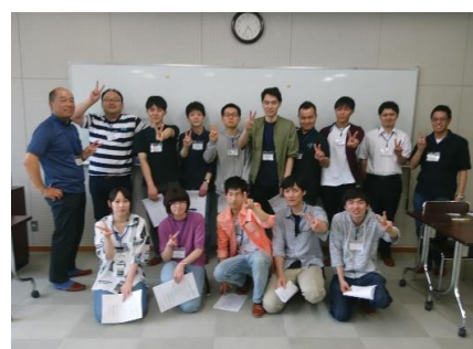
今日一日お互いを知る機会に! これからの活躍を期待しています