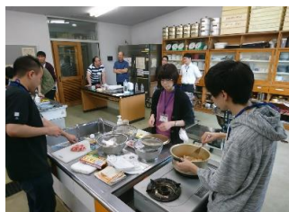
自然と協力 役割分担