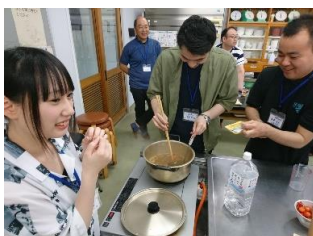
カレー汁から奇跡の回復