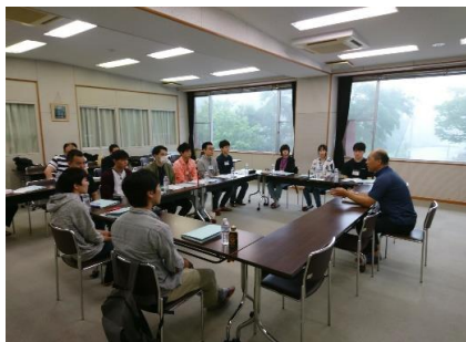
11名の参加者は緊張の面持ち

6月31日(金)にキゴ山ふれあい研修センター(金沢市)で研修交流会を開催しました。 研修交流会の様子を紹介します!