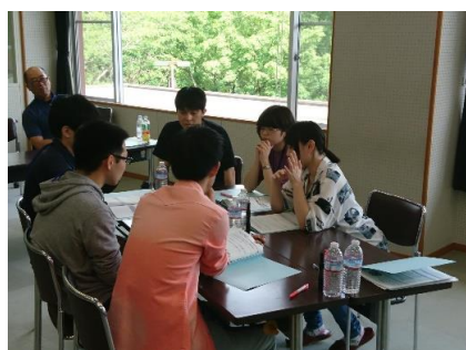
グループディスカッション みんなの悩みも同期で解決