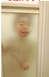
↑我が家のお風呂場に現れる座敷童?(笑)