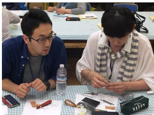
一つ一つ手順を確認しながら(仙台会場)