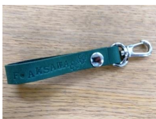
ストラップに名前を入れて (長野会場)

6月13日(水)に長野会場で、29日(金)に仙台会場でイベント交流会が開催されました。今回はタグのアレンジや、色んな刻印を使って模様を作る方が多かったです。同じ色の革でも金具との組み合わせで印象が変わるものですね☆