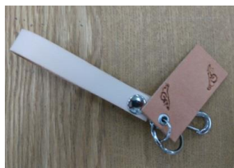
夏らしい白とシンプルな刻印 (長野会場)