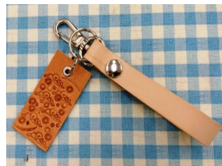
刻印にセンスが光ります (仙台会場)