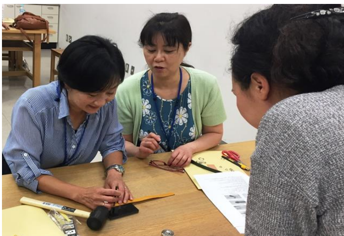
金具を留めるのにドキドキ・・・(長野会場)