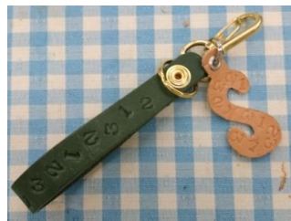
数字を不規則に打ち込んで (仙台会場)